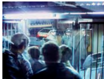
Volkspolizisten stehen an einem der geöffneten Tore an der Grenze in Berlin.