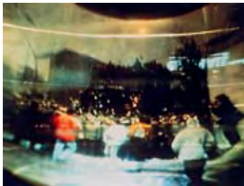
Content, '10 Jahre danach' Passanten strömen am Tag der Grenzöffnung durch ein Loch in der Mauer.