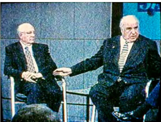
Herr Gorbatschow, Staatspräsident der damaligen UDSSR und Herr Kohl, damaliger Bundespräsident der BRD bei einem Fernsehinterview zum 10. Jahrestag der Maueröffnung.