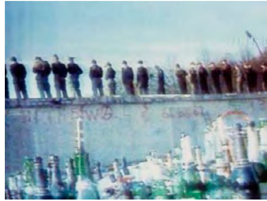
Die Grenze in Berlin nach der Öffnung.