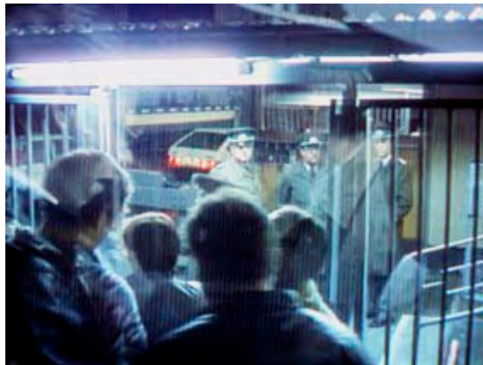
Volkspolizisten stehen an einem der geöffneten Tore an der Grenze in Berlin.