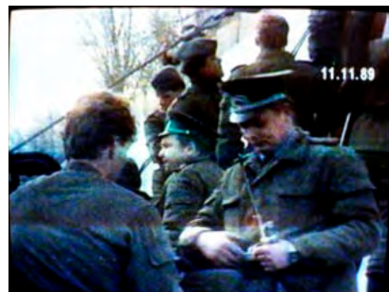
Erste Begegnungen zwischen Ostberliner Grenzpolizei und Westberlinern.