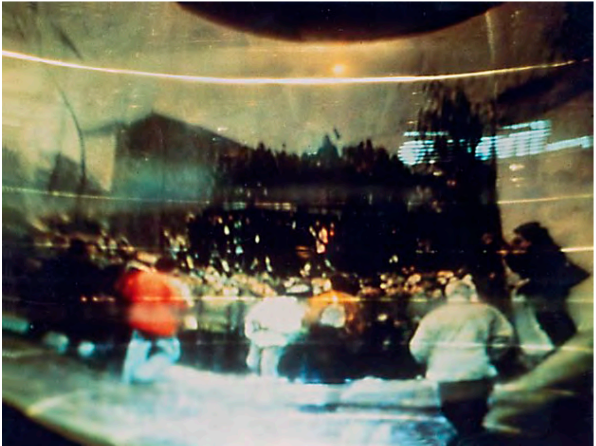
Content, '10 Jahre danach' Passanten strömen am Tag der Grenzöffnung durch ein Loch in der Mauer.