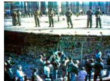
Situation an der Grenze zur Zeit der Grenzöffnung 1989.