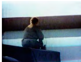
An der früher todbringenden Grenzmauer.