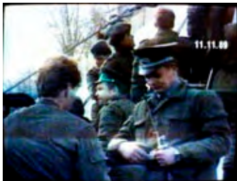
Erste Begegnungen zwischen Ostberliner Grenzpolizei und Westberlinern.