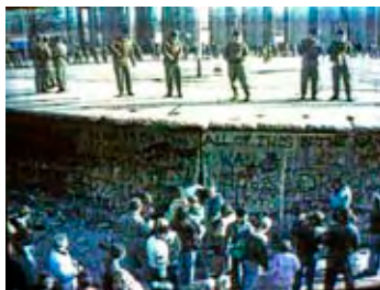
Situation an der Grenze zur Zeit der Grenzöffnung 1989.