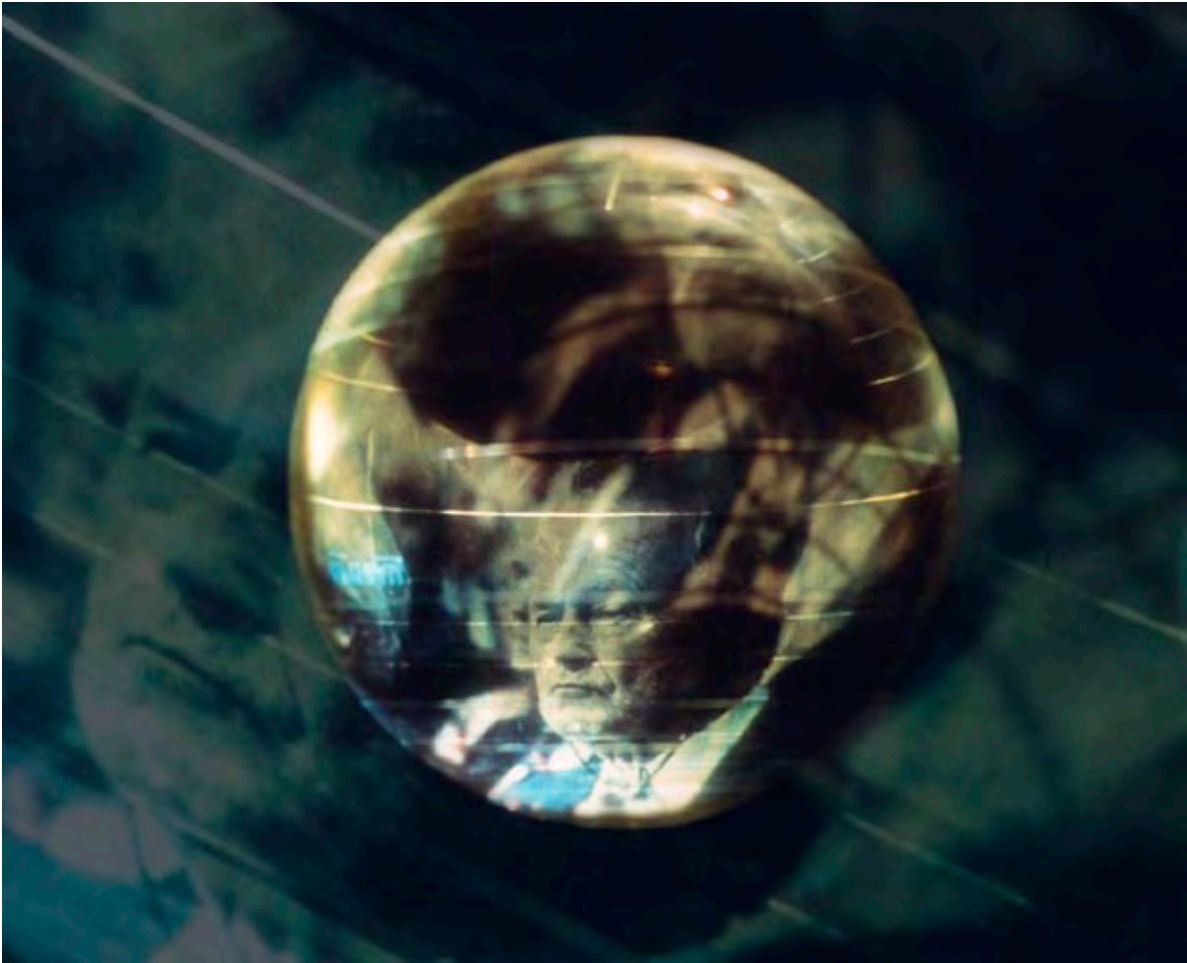
Content, '10 Jahre danach' screenshot aus einer Rede von Bush mit in der Installation zufällig entstandener Spiegelung