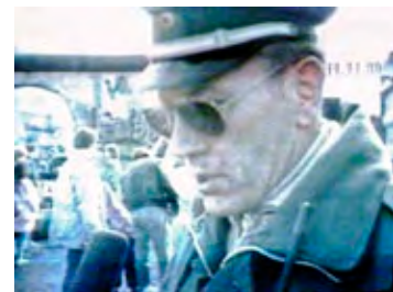
Ostberliner Volkspolizist gibt ein Interview. Einige Tage vorher stand darauf die Gefängnisstrafe.