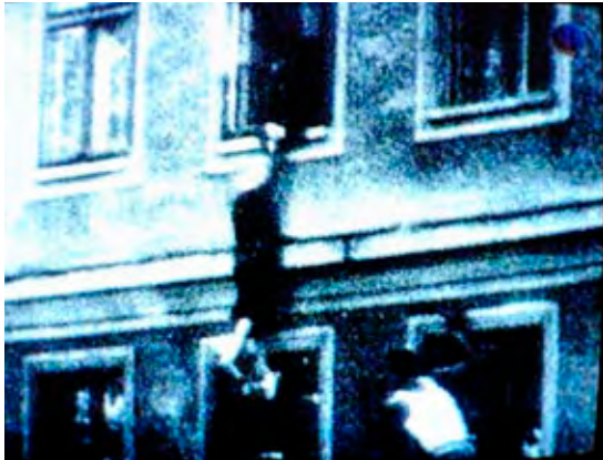
Ältere Dame will durch das Fenster in den Westteil der Stadt springen. Ostdeutsche Grenzsoldaten wollen sie daran hindern.