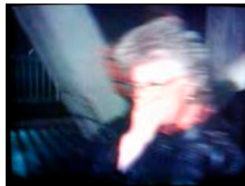
Weinende Frau am Tag der Grenzöffnung in Berlin.