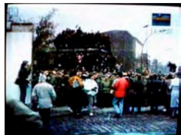
Grenzbezirk von Berlin, durchbrochene Grenzmauer.