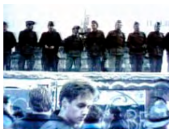
Die Berliner Mauer zur Grenzöffnung.