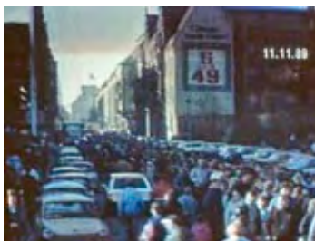
Grenzbezirk von Berlin, Massen von Menschen und Autos strömen über die Grenze.