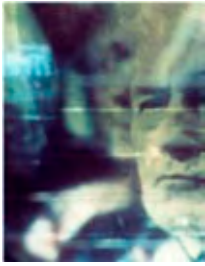
Ausschnitt, screenshot aus einer Rede von Bush mit in der Installation zufällig entstandener Spiegelung.