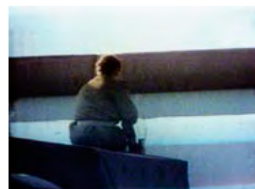
An der früher todbringenden Grenzmauer.