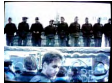
Die Berliner Mauer zur Grenzöffnung.