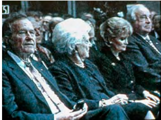
Festakt mit Staatsgästen im 'Roten Rathaus' am 10. Jahrestag der Maueröffnung.