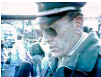
Ostberliner Volkspolizist gibt ein Interview. Einige Tage vorher stand darauf die Gefängnisstrafe.

Ton- und Bildsequenzen der Installation folgten jeweils einem eigenständigen Rhythmus, sodass es bei erneutem Durchlauf des Materials zu immer neuen Kombinationen von Bild und Kommentar kam. Durch dieses zufällige Aufeinandertreffen von Inhalten in Bild und Ton entstanden unerwarteten inhaltlichen Bezüge. Sie erweiterten die Installation um eine gedankliche Dimension.